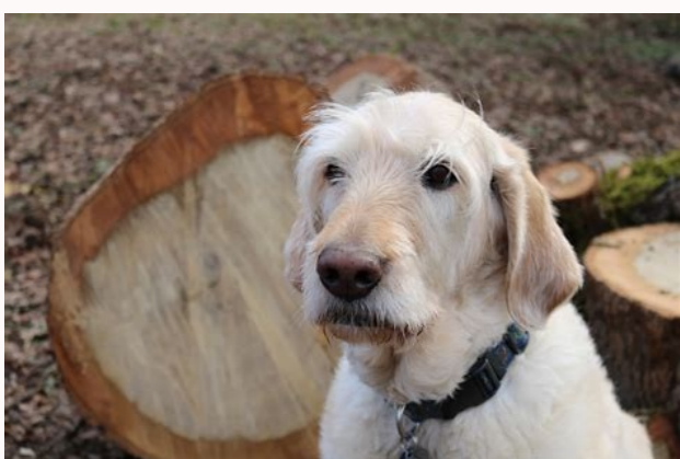
Hemangiosarcoma en perros.