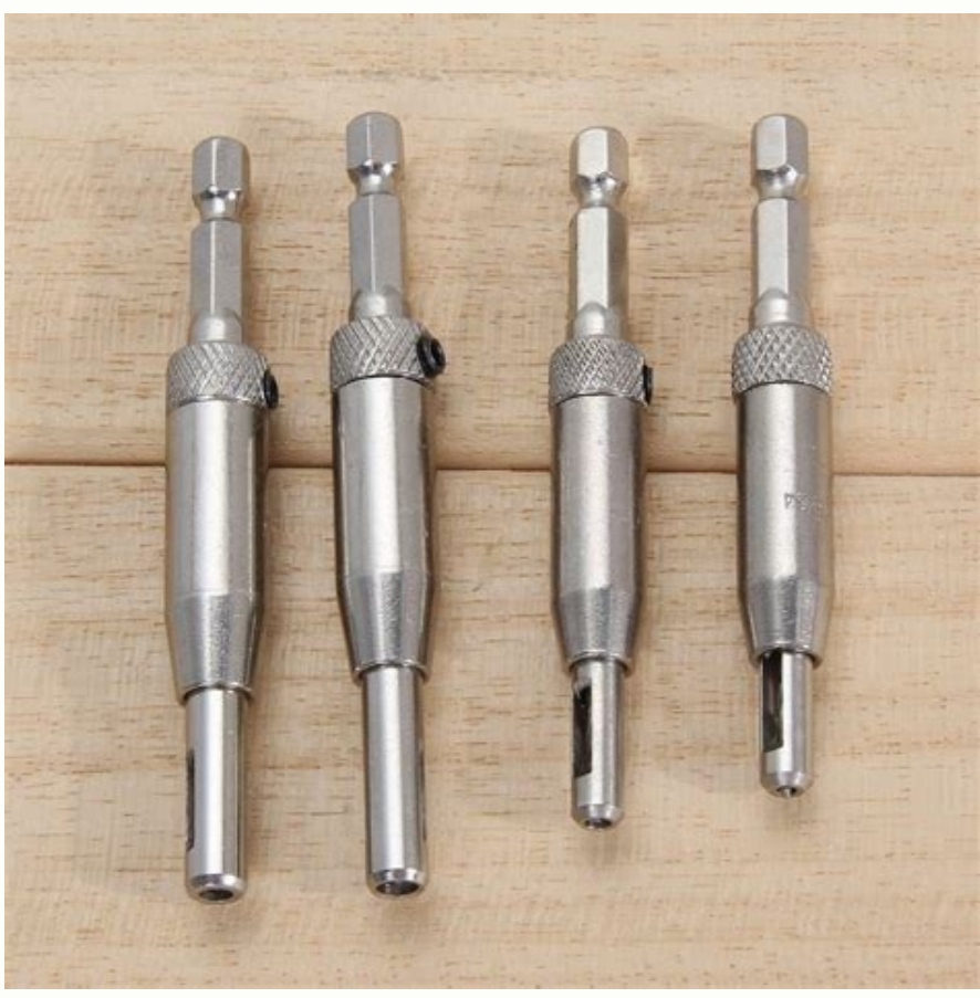
Drill bit guide set